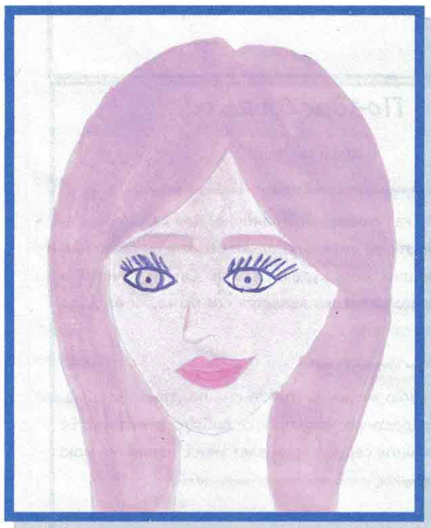
Рисунок Удаловой Анны – 5 «а»

(Отрывок из сочинения Золотаревой Урины – 10 класс)