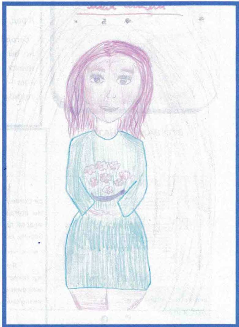
Рисунок Мурзиной Анны – 5 «а»